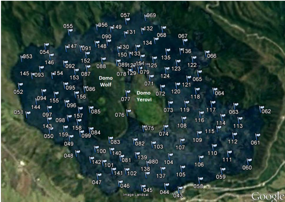
Figura 2. Esquema de la distribución de puntos de medición de CO 2 durante la campaña de septiembre 2016.