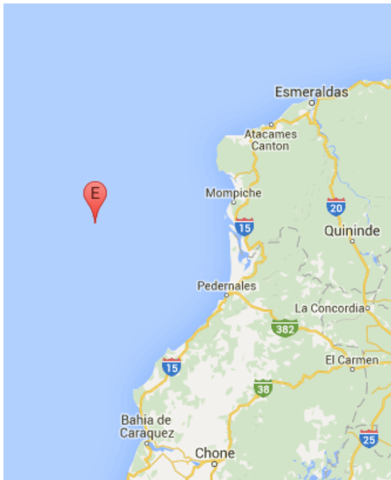
Figura 1. Localización del evento del 01-06-2016 a las 05h05 (TL)

El Instituto Geofísico informa que a las 05h05 (TL) se produjo un nuevo evento sísmico, que corresponde a una nueva réplica del sismo del 16 de abril. Este evento presentó una magnitud de 5.3 localizado costas afuera de Cojimies (Figura 1), posteriormente a las 10h00 y 10h03 (TL) se registró dos réplicas con una ubicación similar a la de las 05h05 (TL).