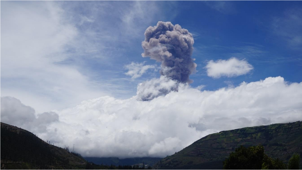
Figura 2. Se observa la emisión con carga moderada de ceniza. Tomada desde el OVT.