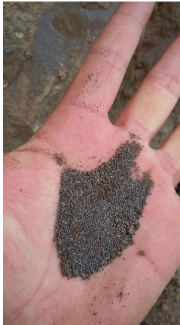
Fig 3. Foto de muestra de gravilla.

La ceniza se caracterizó por ser fina, del tamaño de granos de azúcar. Sin embargo, en el sector de Pillate y Choglontus el tamaño de grano de la ceniza llegó hasta 3 mm y está formada por gravilla de fragmentos rocosos de color rojizo, negro, gris y beige. Figura 3.