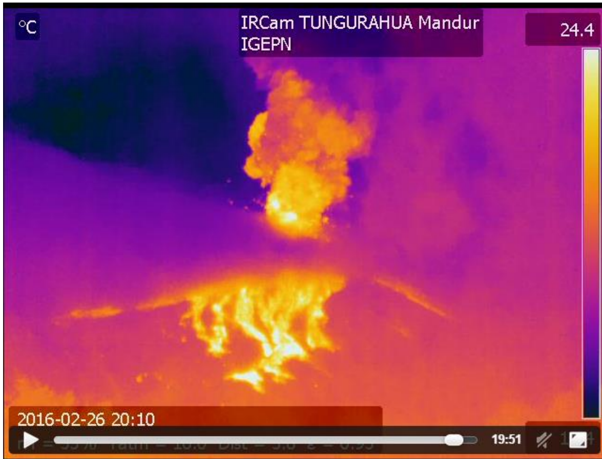
Fig. 1: Imagen tomada a las 15h10TL por la cámara térmica en Mandur, que muestran las huellas dejados por los flujos piroclásticos incandescentes, que llegaron hasta la mitad del cono en la parte Nor-occidental, específicamente las quebradas Mandur, Hacienda y Cusua.

A las 13h33 (TL) se produjo una nueva explosión, la misma que generó flujos piroclásticos pequeños, que llegaron hasta la mitad del volcán. Descendieron por el flanco occidental y nor occidental. Tal como se observa en la imagen tomada desde la cámara ubicada en el sector de Mandur (Fig. 1).