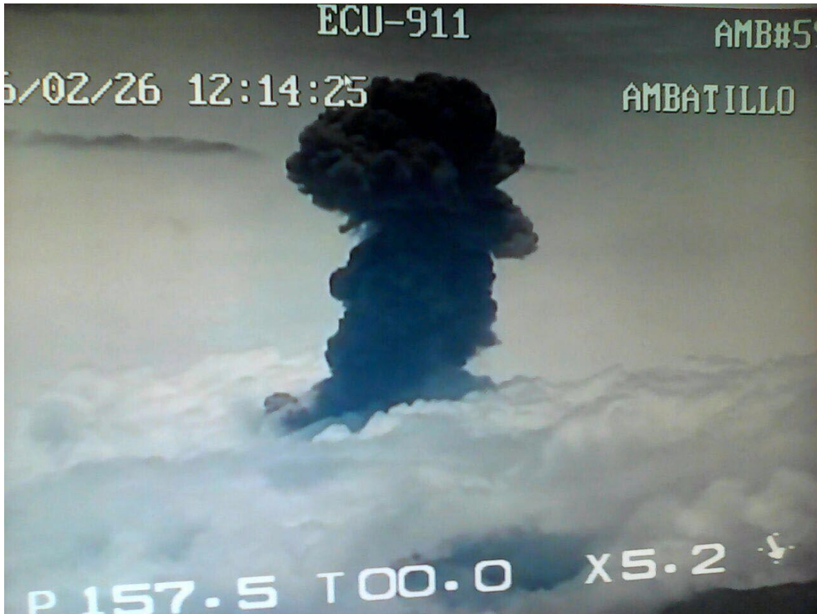
Fig. 4: Foto tomada desde una cámara del ECU911 en Ambatillo, correspondiente a la columna eruptiva asociada con la explosión de las 12h11TL.

Como se indicó al momento el volcán no ha bajado su nivel de actividad que se mantiene moderada, hay una columna de emisión continua que dirige al occidente con contenido de ceniza moderada.