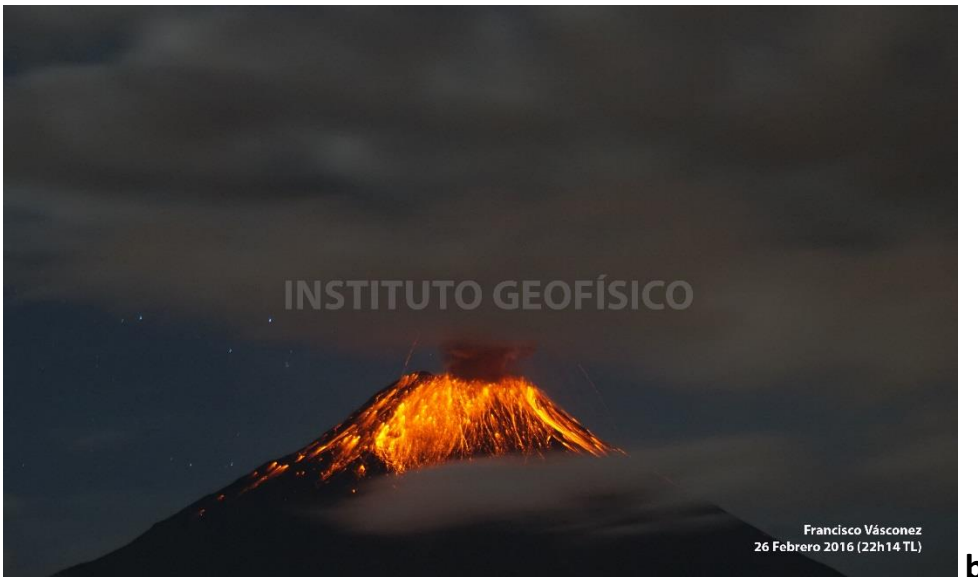
Fig. 2: 2a Imagen de depósitos incandescentes producidos luego de una explosión, foto tomada desde el OVT cerca de las 19h00 (TL). 2 b. Actividad estromboliana observada a las 22h14 TL, los bloques descendieron aproximadamente 1500 m bajo la cumbre.

Esta actividad corresponde a una ruptura del tapón rocoso del conducto volcánico y que estaba bloqueando la salida de gases y magma. Este evento se evidencia por la caída de gravilla de varios colores que se depositó en Choglontus y Pillate. El depósito de ceniza hasta ahora medido, representa un evento de caída intensa durante un corto periodo de tiempo.