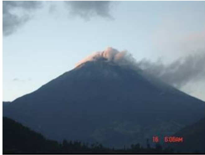
Fig. 1. Vista NW del volcán. Se observa las emisiones de vapor, gases y ceniza

20h15: El volcán se despeja y se observa las emisiones compuestas principalmente de vapor, gases y algo de ceniza. Las emisiones llenan todo el cráter y suben hasta unos 100 msnc y son desplazadas a sotavento por el flanco superior WNW y los vientos llevan los materiales hacia el W.