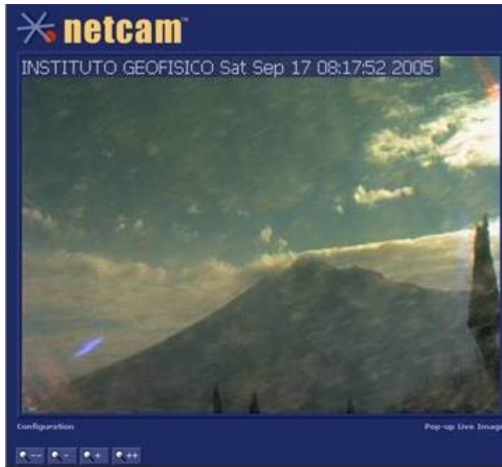
Vista del V. Tungurahua desde Bayushig.