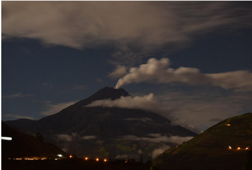
Figura 1. Emisión continua de vapor de agua y gases dirigida hacia el occidente. Fotografía: Vásconez F. - IG/OVT, 24/11/2015)

A partir de las 19:00 (tiempo local) del martes, 24 de noviembre de 2015 se está registrando un enjambre de sismos LP (movimiento de fluidos), acompañado de tremor de emisión que inició a las 21h00 (TL) y tuvo una duración de aproximadamente una hora. A nivel superficial se observó una emisión continua de vapor de agua y gases, con contenido muy bajo de ceniza. Dicha emisión no superó los 800 m sobre el nivel del cráter y se dirigió hacia el occidente por la acción de los vientos (Fig. 1).